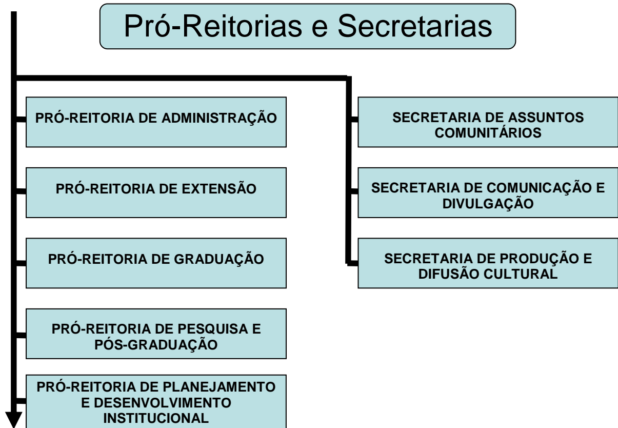
Figura 2: Estrutura Organizacional da UFES: Pró-Reitorias e Secretarias