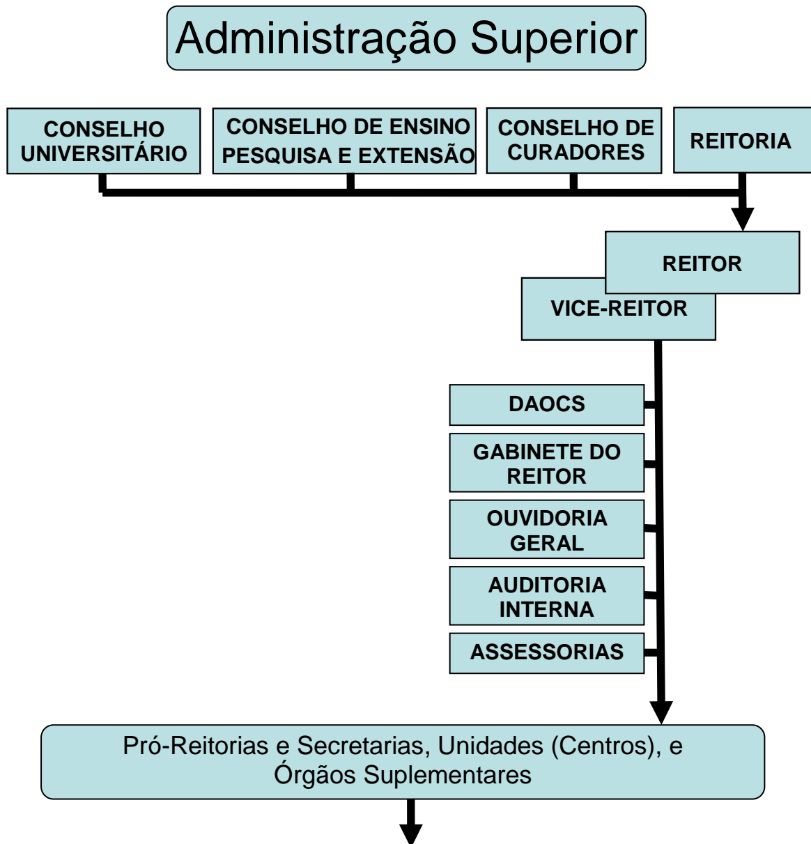
Figura 1: Estrutura Organizacional da UFES: Administração Superior